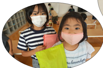
姉妹で景品ゲット!