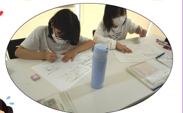
6年生は宿題が多い!