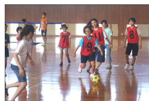
シュートを決める🍀