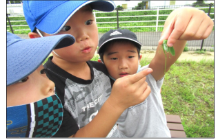
ギリギリス見つけた!