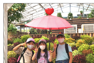
インスタ映えショット(´ω´)